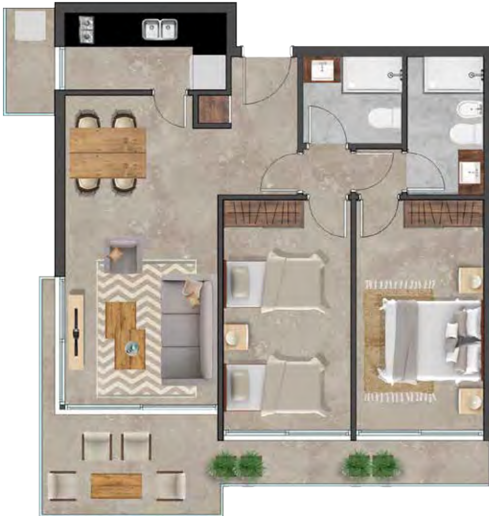
ESQUINERO Área total 85 m 2