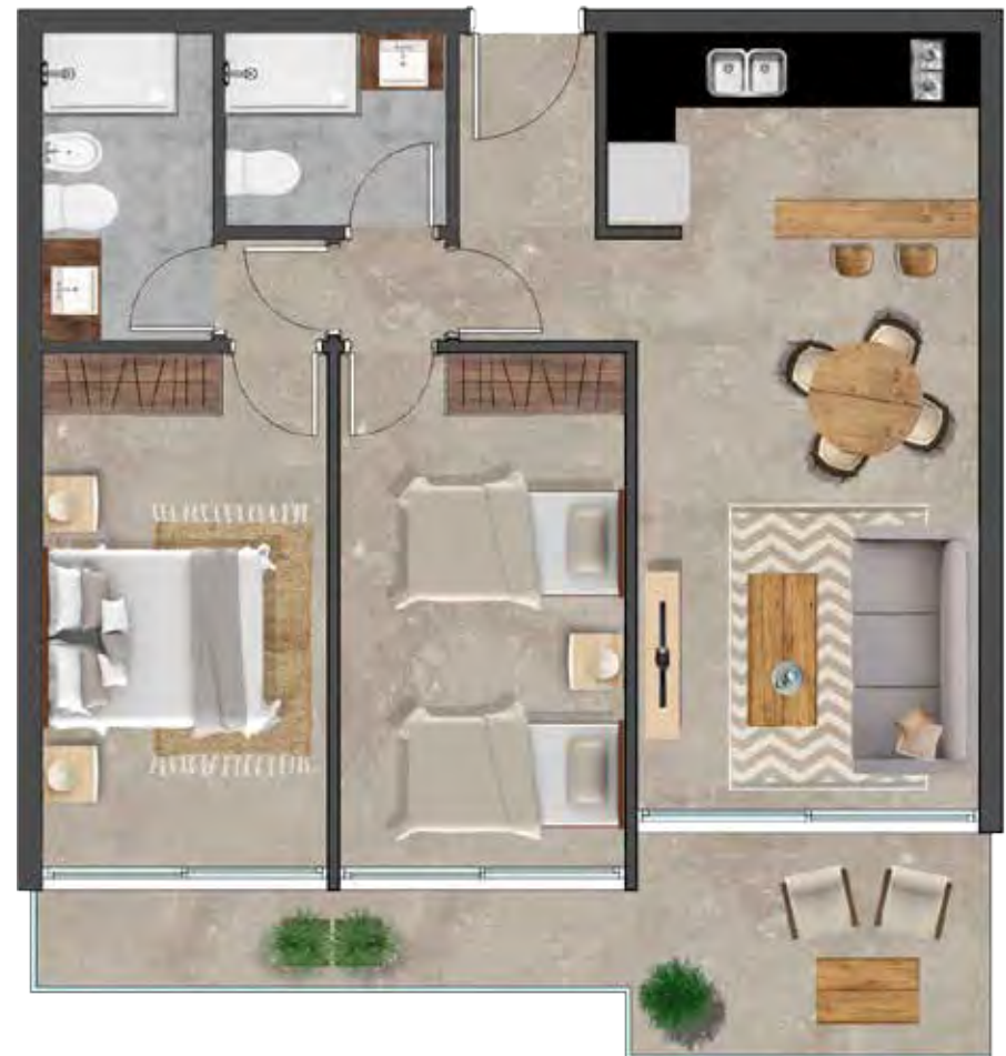
CENTRAL Área total 80 m 2

Las medidas generales corresponden al proyecto, pudiendo sufrir aumentos o disminuciones menores durante la obra. Las especificaciones constructivas son indicativas y podrán modificarse a criterio de los desarrollistas sin perjuicio de mantener las calidades generales.